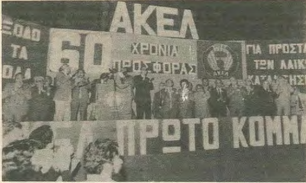
Απο προεκλογική συγκέντρωση του ΑΚΕΛ

από πιο νέους δεν λύει το πρόβλημα (μια τάση που άρχισε ήδη να αναπτύσσεται μέσα στο κόμμα) ούτε και η φραστική αγωνιστική τοποθέτηση της ηγεσίας σε επιμέρους ζητήματα.